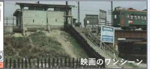
映画のワンシーン

HN 08 帝塚山四丁目 HN 10 住吉 TEZUKAYAMA-4CHOME SUMIYOSHI